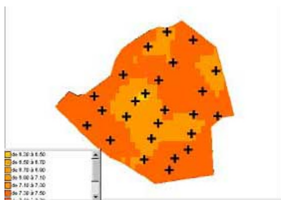
Alcool en % du volume

Réaliser des cartes interpolées à l'intérieur d'une zone ou d'une parcelle, à partir d'un maillage de point : prélèvement d'analyses géoréférencées, comptage géopositionné qui peuvent être importés à partir de fichiers externes.